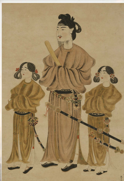
聖徳太子像(御物模写)