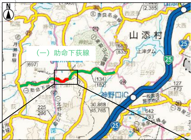
「奈良県道路網図(平30情使、第1149号)を転載」