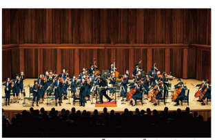
スーパーキッズ・オーケストラ

「0歳からのコンサート」(有料)など小さな子どもと一緒に楽しめる日。「こどもたちの音楽アトリエ」や会館前広場でのコンサートなどが楽しめます。